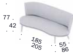
Sofa 205 nierenförmig BW-107-3004